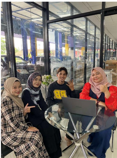
ภาพ ข. ๒ เข้าพบที่ปรึกษา