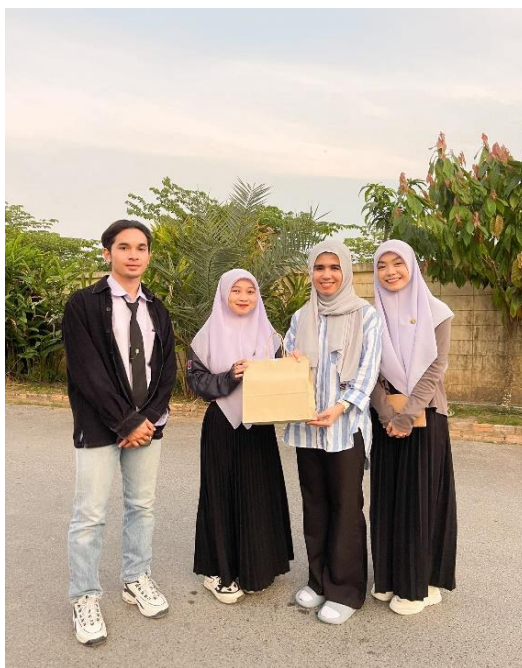
ภาพ ข. ๓ ลงพื้นที่สัมภาษณ์สจ.นาเดีย พร้อมมูล