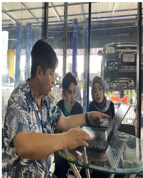
ภาพ ข.๔ ผู้ทรงตรวจแบบสัมภาษณ์และแบบสอบถาม