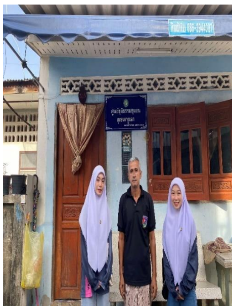
ภาพ ข.๔ ผู้ทรงตรวจแบบสัมภาษณ์และแบบสอบถาม