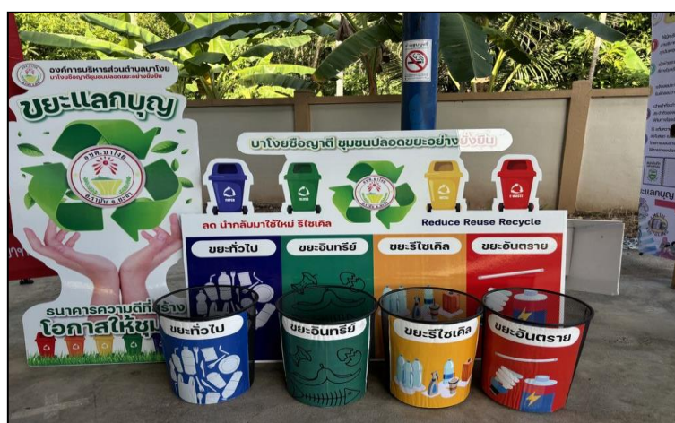
ภาพที่ 2 กิจกรรมขยะแลกบุญ

ด้านการมีส่วนร่วมของนักเรียนโรงเรียนผู้สูงอายุได้มีส่วนร่วมด้านจิตอาสาด้านภูมิปัญญาของโรงเรียนผู้สูงอายุองค์การบริหารส่วนตำบลบาโจย ได้มีการสอนทำสื่อให้กับเด็กๆ เมื่อมีกิจกรรมต่างๆของผู้สูงอายุก็ได้ถ่ายทอดความรู้ที่มีด้านการทำสื่อกับต้นหนามเตยให้กับกลุ่มผู้สูงอายุได้เรียนรู้ภูมิปัญญา การมีส่วนร่วมในโครงการขยะแลกบุญ และได้มีส่วนร่วมในกิจกรรมตลาดนัดสีเขียว