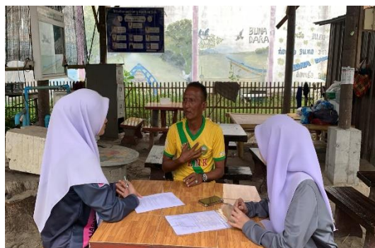
ภาพถ่ายสัมภาษณ์ประชาชนกับกลุ่มวิสาหกิจ