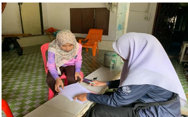
ภาพถ่ายสัมภาษณ์สภาองค์การบริหารส่วนตำบลตะโละกาโปร์