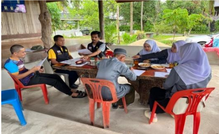
ภาพที่ ข. 4 สัมภาษณ์ ผู้ใหญ่บ้าน ตำบลบาโร๊ะ อำเภอยะหา จังหวัดยะลา