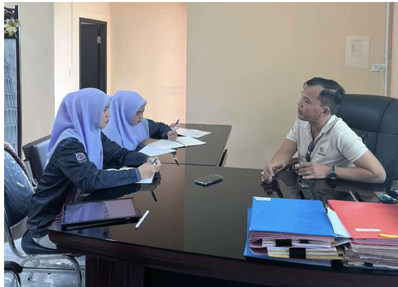
ภาพที่ ข. 1 สัมภาษณ์ นายกองค้การบริหารส่วนตำบลบาโร๊ะ อำเภอยะหา จังหวัดยะลา