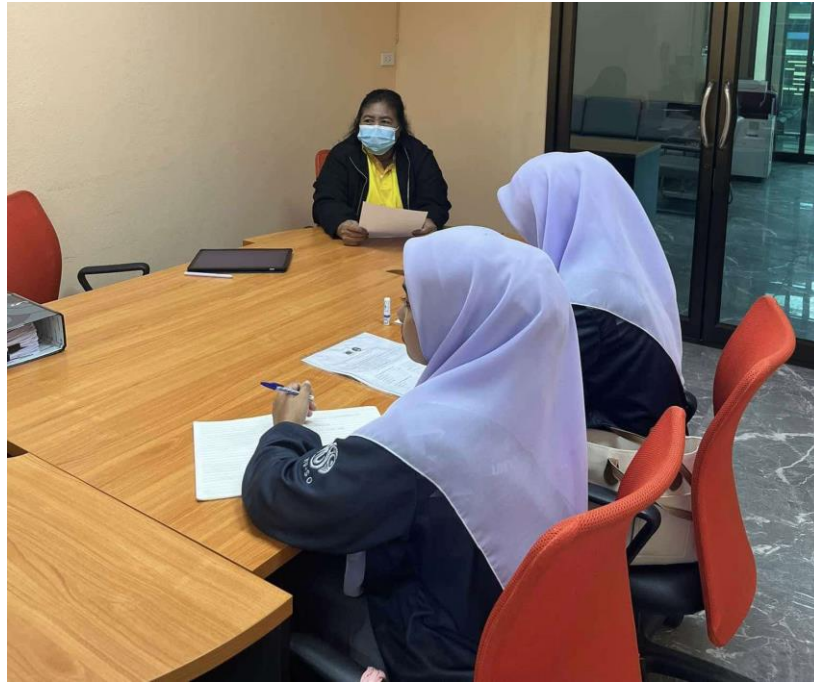
ภาพที่ ข. 2 สัมภาษณ์ ปลัดองค์การบริหารส่วนตำบลบาโร๊ะ อำเภอยะหา จังหวัดยะลา