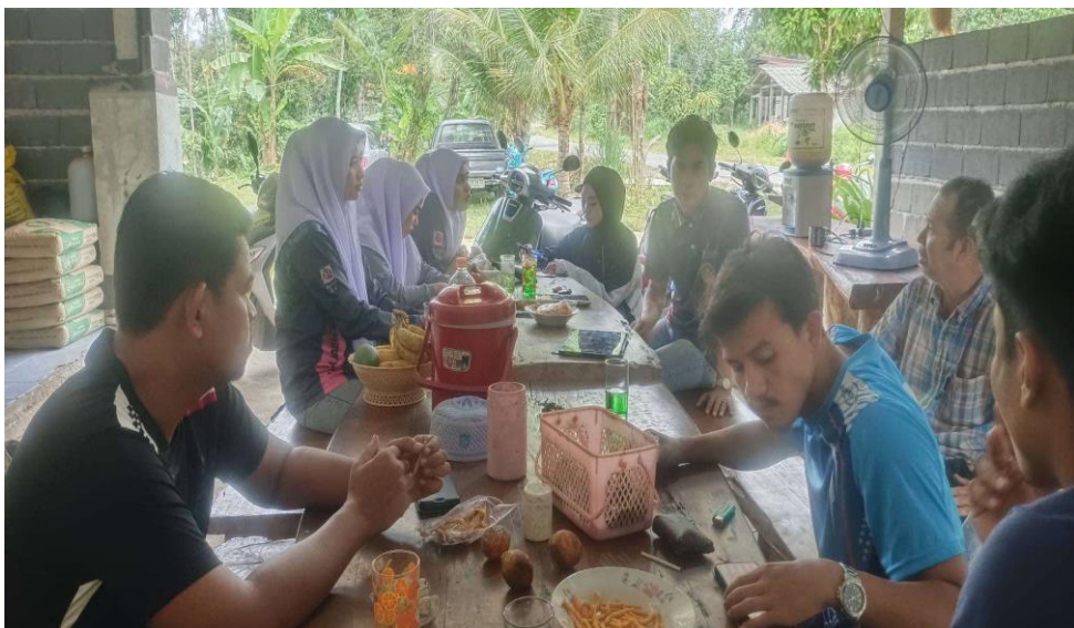
ภาพที่ ข. 5 สัมภาษณ์ แกนนำและกลุ่มเยาวชน ตำบลบาโร๊ะ อำเภอยะหา จังหวัดยะลา