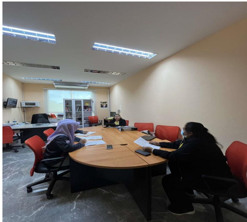
ภาพที่ ข. 3 สัมภาษณ์ เจ้าพนักงานธุรการชำนาญงาน ตำบลบาโร๊ะ อำเภอยะหา จังหวัดยะลา