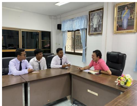
ภาพที่ 2 ลงพื้นที่สัมภาษณ์รองปลัดองค์การบริหารส่วนตำบลลำพะยา