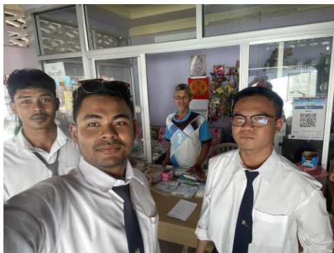
ภาพที่ 7 ลงพื้นที่สัมภาษณ์ชาวบ้านหมู่ที่ 4 ตำบลลำพะยา