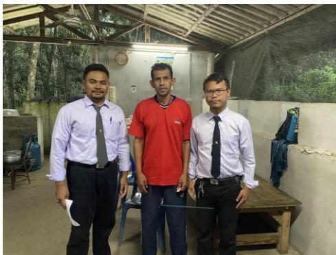
ภาพที่ 4 ลงพื้นที่สัมภาษณ์ผู้ใหญ่อำเภอบ้านหมี่ที่ 6 ตำบลลำพะยา