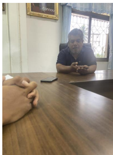
ภาพที่ 3 ลงพื้นที่สัมภาษณ์กำนันตำบลลำพะยา