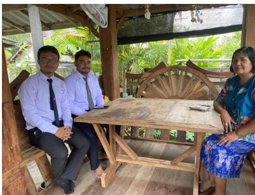
ภาพที่ 5 ลงพื้นที่สัมภาษณ์ชาวบ้านหมี่ที่ 6 ตำบลลำพะยา