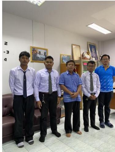
ภาพที่ 1 ลงพื้นที่สัมภาษณ์รองนายกองค์การบริหารส่วนตำบลลำพะยา