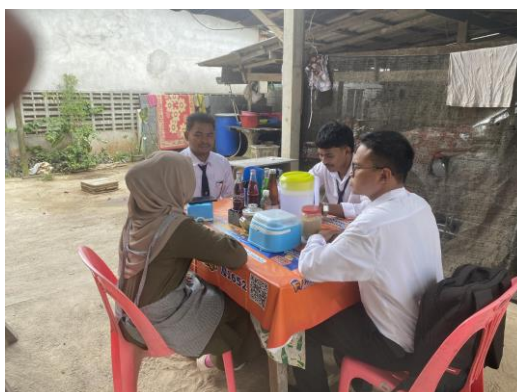
ภาพที่ 6 ลงพื้นที่สัมภาษณ์ชาวบ้านหมี่ที่ 5 ตำบลลำพะยา