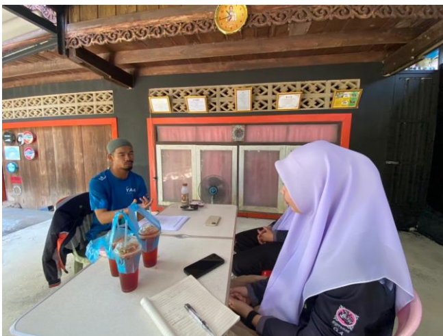
สัมภาษณ์ผู้ให้ข้อมูลหลักกลุ่มเลี้ยงผึ้งชั้นโรงบ้านป้อมัง