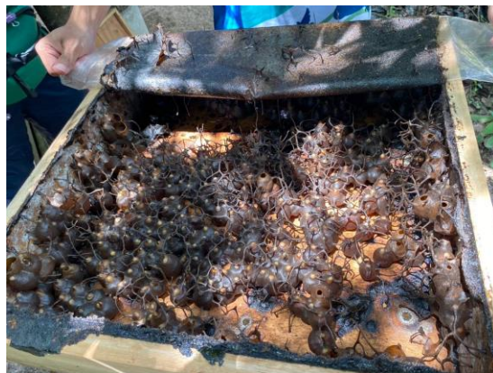
เก็บข้อมูลและรวบรวมข้อมูล