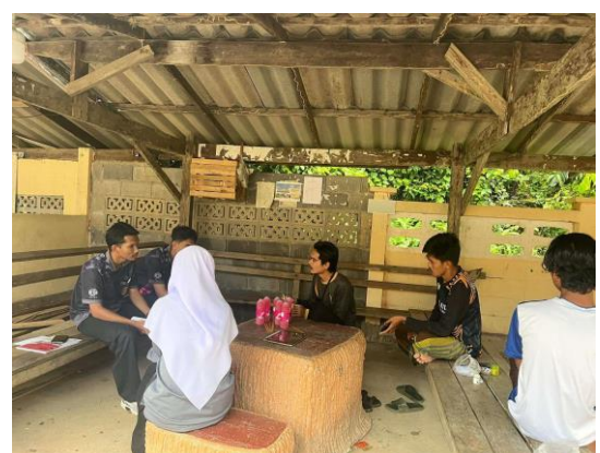
สัมภาษณ์ประธานกลุ่มเยาวชนและกลุ่มเยาวชนบ้านจาระะฆาดง