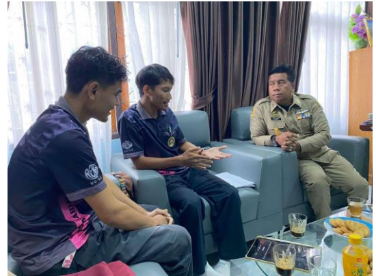
สัมภาษณ์นายกองค์การบริหารส่วนตำบลห้วยกระทิง