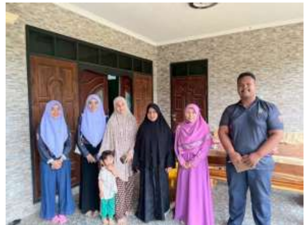
ลงพื้นที่เก็บข้อมูลเชิงพื้นที่ ณ บ้านกียะะ หมู่ที่ 4 ตำบลกรงปินัง อำเภอกรงปินัง จังหวัด ยะลา