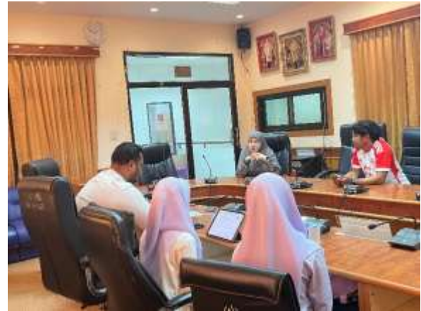
ลงพื้นที่สัมภาษณ์ นายองค์การบริหารส่วนตำบลกรงปินัง