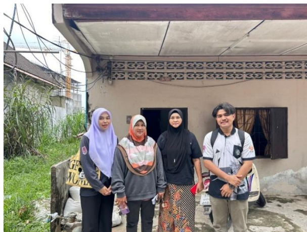
๓.๙ ชุมชนท่ากอไผ่