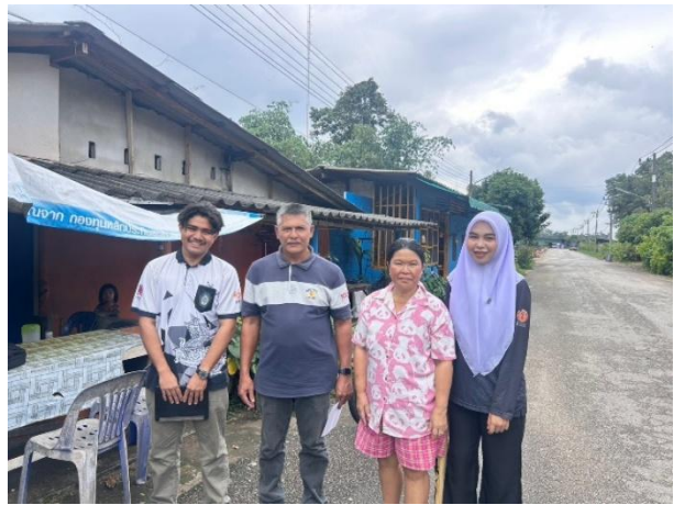
๓.๗ ชุมชนเสาศีลสถาน