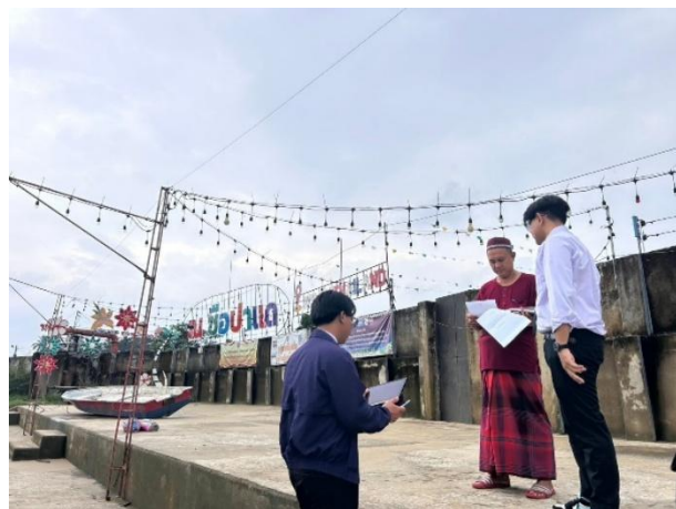
๓.๔ เทศบาลเมืองสุโขทัย