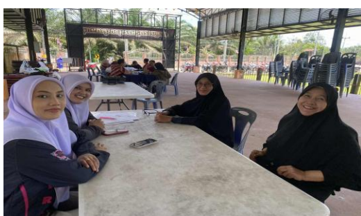
ภาพสัมภาษณ์ผู้ให้ข้อมูลหลัก