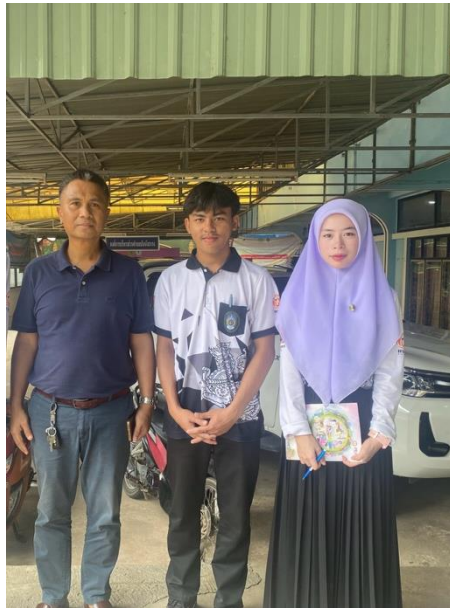
ภาพที่ 1 : ลงพื้นที่เก็บข้อมูลกับนายกอบต.