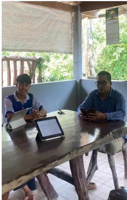
ภาพที่ 2 : ลงพื้นที่เก็บข้อมูลจากผู้ใหญ่บ้าน