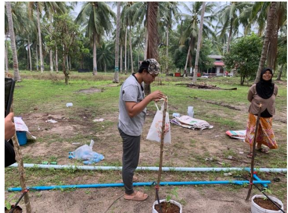
ภาพถ่ายสัมภาษณ์กลุ่มเกษตรกร